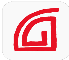
Das Logo der SokratesGroup und seine Teile.